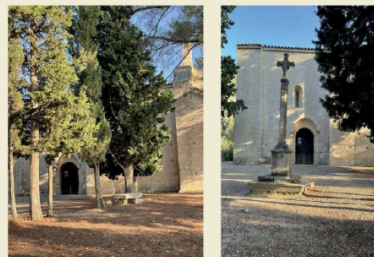
Au milieu des vignes, des oliviers et des pins

Plan de la Chapelle Toutes les places sont numérotées Les musiciens sur une haute estrade